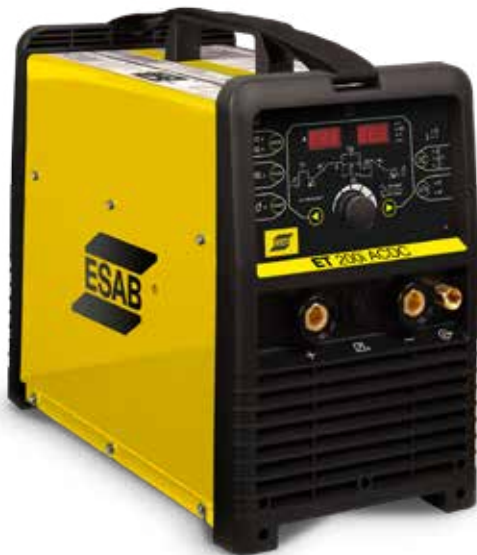
ET 200i AC/DC